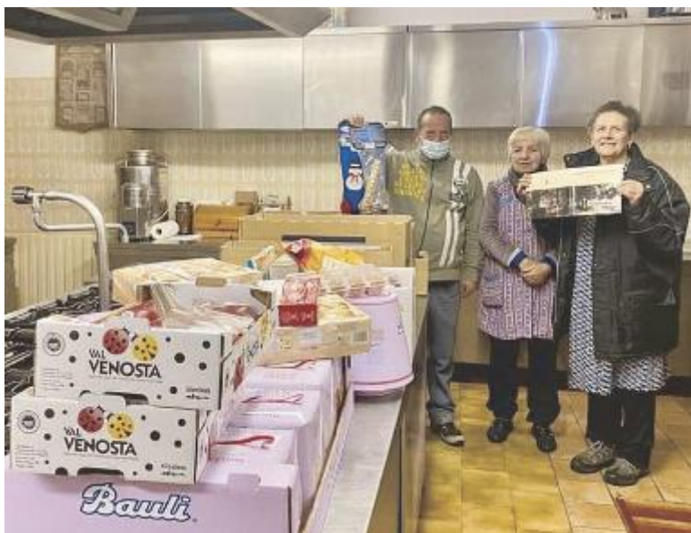
Ecco il dono ricevuto a Natale dalla casa famiglia

La solidarietà a Piancastagnaio arriva attraverso l'iniziativa della raccolta 'Natale sospeso' per acquistare la spesa sospesa, iniziativa ideata da una volontaria di Abbadia San Salvatore e che ha coinvolto i principali centri commerciali dei due paesi dell'Amiata. Ad Abbadia, per la Caritas Parrocchiale della Chiesa del Santissimo Salvatore, che in questo grave momento di difficoltà dovuto alla pandemia ha visto crescere il numero di famiglie bisognose assistite dai volontari del paese. Alla vigilia di Natale è accaduto un piccolo miracolo nella Comunità della Resurrezione di Piancastagnaio, opera voluta dallo